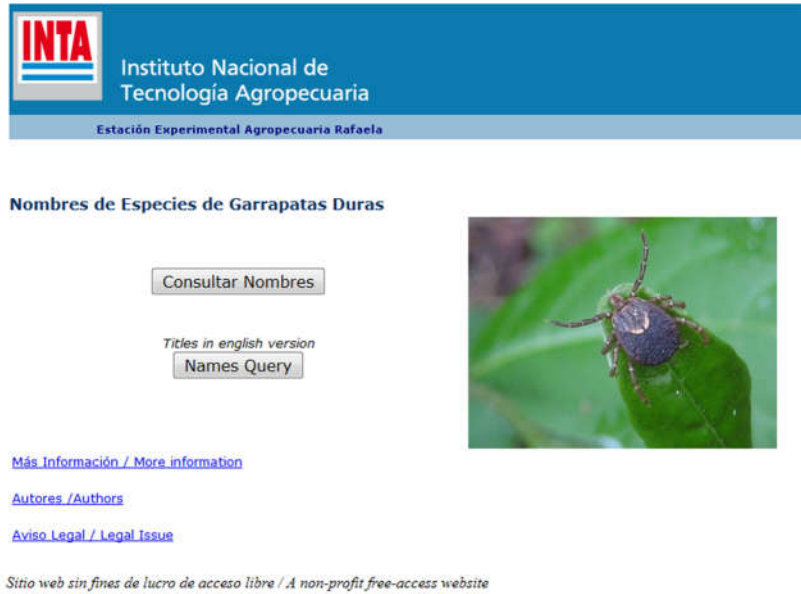
Fig. 1. Pantalla de bienvenida al sitio web.