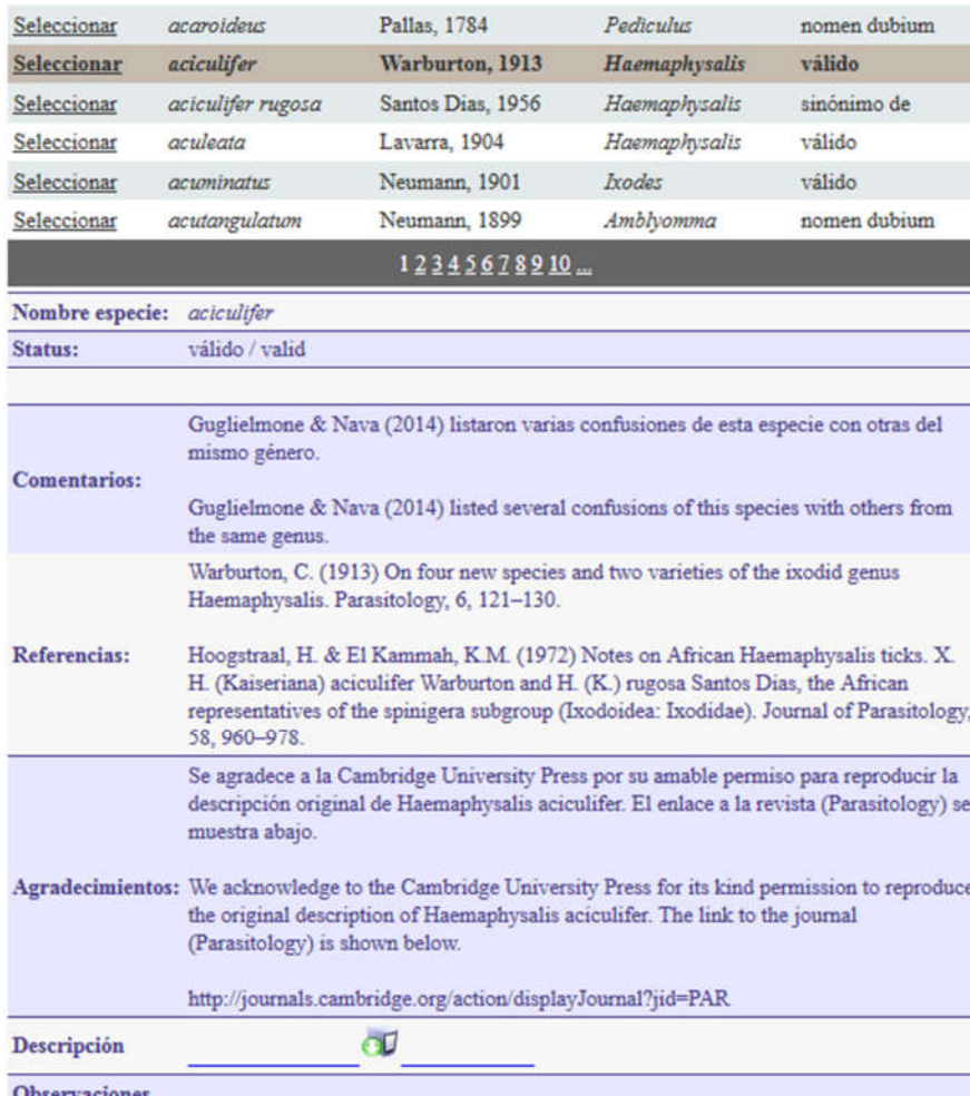
Fig. 3. Pantalla con el detalle de la información solicitada.

En relación a aspectos legales fueron consultadas fuentes oficiales a fin de garantizar que el sitio web cumpla con las normas de propiedad intelectual. En virtud de ello se determinó un responsable de contacto para cualquier comunicación referida al sitio.