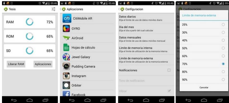
Figura 1: Aplicación Vigía de Cuotas

Aplicación vigía de cuotas: esta aplicación tiene como objetivo permitirle al usuario definir cuotas para el control de la posible saturación de los recursos más críticos del sistema, tales como: almacenamiento en memoria interna y externa, porcentaje de CPU utilizado, nivel de batería, volumen de datos transferidos, etc. La aplicación funciona emitiendo alarmas cuando se alcanzan los niveles definidos para cada una de las cuotas configuradas por el usuario; además pueden verse en todo momento los niveles de uso de cada uno de los recursos contemplados.