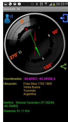
Fig. 8 - Función de compas

con una flecha verde la dirección hacia la cual dirigirse para encontrar con la dirección o localidad deseada. Es posible como en todas las otras opciones del software por medio de la opción compartir enviar un mensaje ya sea por correo, SMS o redes sociales con nuestra ubicación.