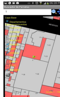
Fig. 5 - Posicionamiento próximo

En este punto es necesario aclarar que la precisión de los sistemas de posicionamiento global (GPS) de los dispositivos móviles estará superditada a la precisión de cobertura de la señal provista por el proveedor del servicio de la red celular. La geoposición puede ser suministrada indistintamente por el GPS integrado al dispositivo, o bien, por el cálculo de distancias a torres de comunicación (triangulación) del dispositivo. Existe un indicador de precisión del GPS en el sistema consistente en un ícono de intensidad de señal que pasa de rojo a verde en caso de que el error sea menor a 10 metros.