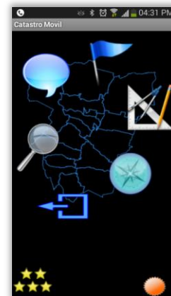
Fig.2 - Layout del menú principal

smartphone en lo referente al despliegue del menú principal. Para ello se concibieron sólo siete elementos consistentes en los botones de acciones o eventos y un mapa central de referencia con las siguientes opciones: Buscador de Parcelas, Preguntas, Posicionamiento Próximo, Planos PDF, Compas y el botón Salir.