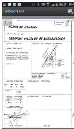
Fig. 7 - Visualización de un mapa en el celular

Haciendo uso de la amplia gama de aprovechamiento de los sensores del celular, tanto para la opción Buscador de Parcelas como la de Posicionamiento Próximo, al fijar un padrón y "sacudir" levemente el teléfono, la aplicación envía una solicitud a los servidores de la Dirección General de Catastro para que proveer de información sobre dicho padrón. Al igual que en oportunidades anteriores, es posible compartir esta información o bien almacenarla en formato de texto dentro del teléfono.