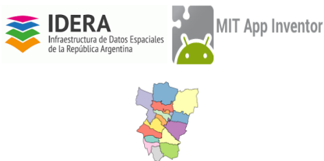
Fig. 1 - Triángulo tecnológico de desarrollo

Adicionalmente a la plataforma de programación innovadora empleada se hizo fuerte hincapié en la utilización de la Infraestructura de Datos Espaciales (IDE) operativa en la Dirección General de Catastro en calidad de nodo referente. A tal efecto cabe destacar que la Infraestructura de Datos Espaciales de la República Argentina (IDERA) es una comunidad de información geoespacial que tiene como objetivo propiciar la publicación de datos, productos y servicios de manera eficiente y oportuna como un aporte fundamental a la democratización del acceso de la información producida por el Estado principalmente.