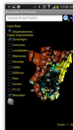
Fig.3 - Layout del mapa y layers

Los criterios adoptados para el desarrollo de esta plataforma en lo referente a qué tipo de información espacial proyectar en un smartphone tuvieron que circunscribirse a una síntesis de las arquitecturas de las principales capas de datos a mostrar. Para ello se definió un set de capas con una granularidad de escala de mayor a menor, comenzando por un despliegue de la capa principal de Departamentos de la provincia, comunas, localidades, manzanas, parcelas, calles y edificios. Se complementaron las capas de zonas agroecológicas, ríos y ductos.