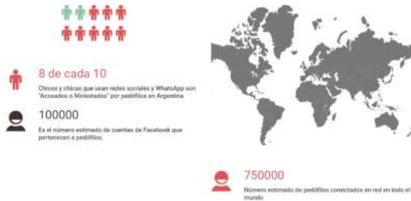
Fig. 1. Estadísticas Alarmantes

En 2012, el actual ministro de Justicia de la Nación, Germán Garavano creó el Equipo Especializado en Delitos Informáticos de la Fiscalía de la ciudad de Buenos Aires.