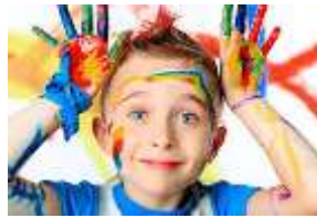
Fig. 2. Ejemplo de función hash sobre un archivo de imagen Valor de hash: bf36959f2619d4a790a644f9c5b256d4

Los hash o funciones de resumen son algoritmos que consiguen crear a partir de una entrada (un archivo, por ejemplo) una salida alfanumérica de longitud fija que representa un resumen de toda la información que se le ha dado, es decir, a partir de los datos de la entrada crea una cadena que solo puede volverse a crear con esos mismos datos.